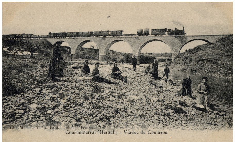
Pézenas Cournonterral (Hérault) - Viaduc du Coulazou

Bâti par l'ingénieur en chef GUIBAL, le pont a pour particularité d'être en pierre de maçonnerie, contrairement aux autres ponts ferroviaires qui sont généralement en fer. Il mesure 100 m de long et culmine à 57 m au-dessus du Coulazou. Il a une hauteur sous clé de 11 m. Ses parements externes sont en moellons, inégalement taillés de pierre calcaire froide. Il est composé de 5 arches en plein cintre : arc semi-circulaire sans brisure, la courbe correspond à un demi-cercle. Ces arches sont soutenues par des claveaux (pierre taillée en forme de coin) bien appareillés et qui reposent sur des piliers maçonnés. Les protections latérales sont en fer.